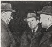
Na man robes nos ta mira U Thant ora of a yega Cuba pa negocia cu Fidel Castro. El a wordo nabri na aeropuerto di Habana door di Oswaldo Dorticos (r.) y Raul Roa (d.), ministro di Relaciones Exteriores. Na man drechi nos ta mira Anastas Mikoyan na su yegada na New York henito cu Vasily Kuznetsov.